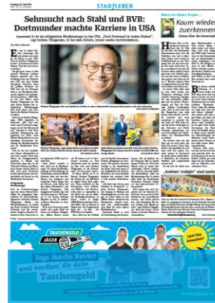
1/4 Seite 7sp./100 mm