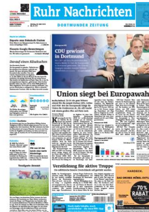
Titelfuß 1sp./50 mm