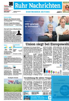
Titelfuß 2sp./100 mm