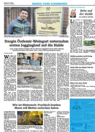
2/100 2sp./100 mm