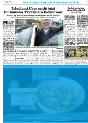
1/2 Seite 7sp./225 mm