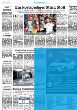
1000er Eckfeld 4sp./250 mm