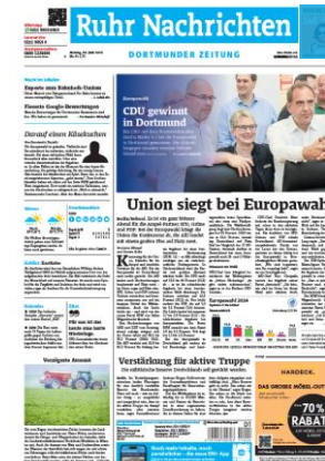
Titelfuß 1sp./50 mm