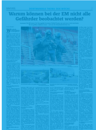
1/1 Seite 7sp./450 mm