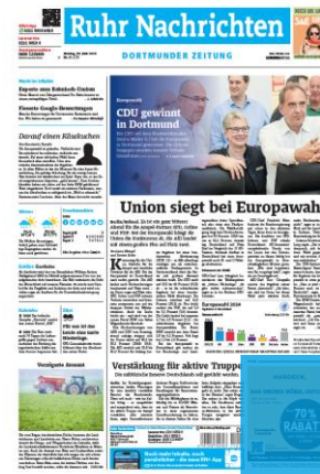
Titelfuß 2sp./100 mm