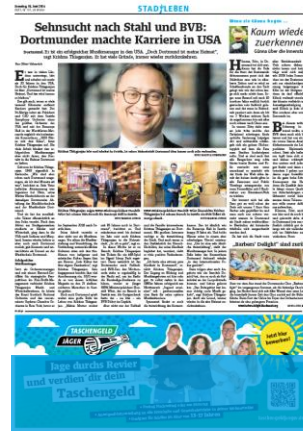
1/4 Seite 7sp./100 mm